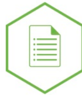
DOCUMENT USE UTILISATION DE DOCUMENTS