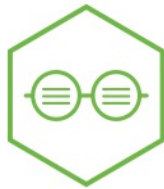
READING TEXT LECTURE

Lorsque vous avez terminé tous les travaux de soudage, vous devez meuler les soudures sur le dessus et à l'avant des joints du bas de caisse seulement. ARRÊT