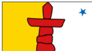
Skills Canada Nunavut www.skillsnunavut.ca