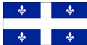
Compétences Québec www.compétencesquebec.com