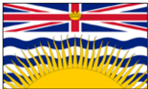
Skills Canada Colombie-Britannique www.skillscanada.bc.ca