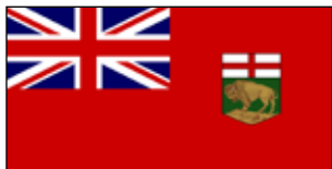
Skills Canada Manitoba www.skillsmanitoba.ca