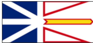
Skills Canada Terre-Neuve-et-Labrador www.skillscanada-nfld.com